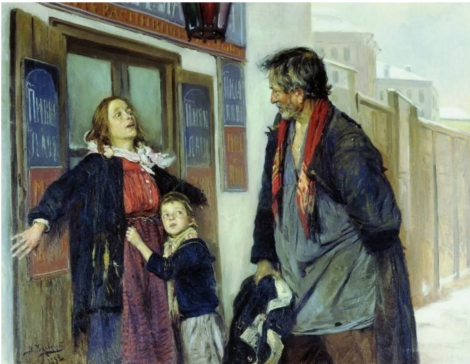
В. Маковский. Не пущу