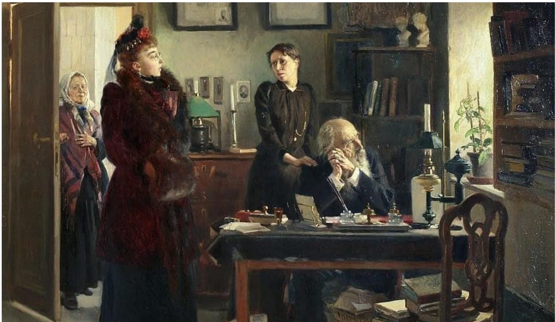
В. Маковский. Две сестры