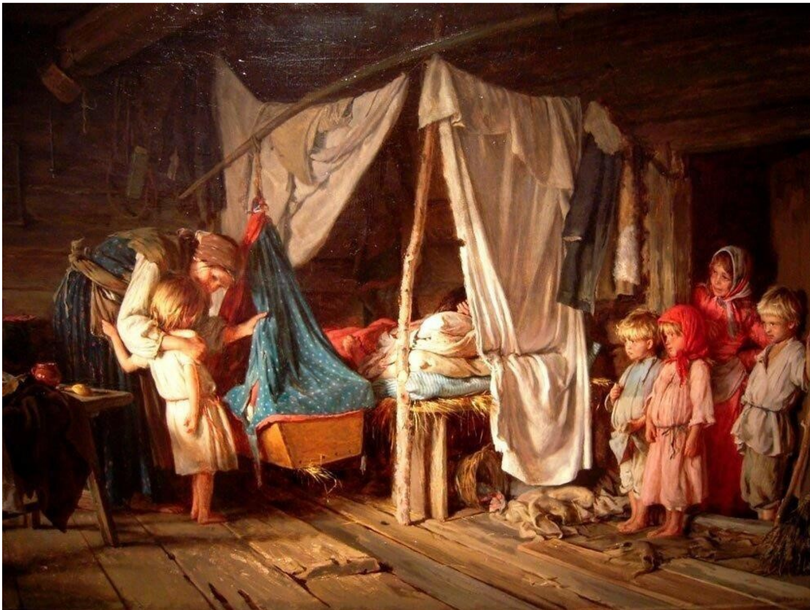
К. Лемох. Новый член семьи