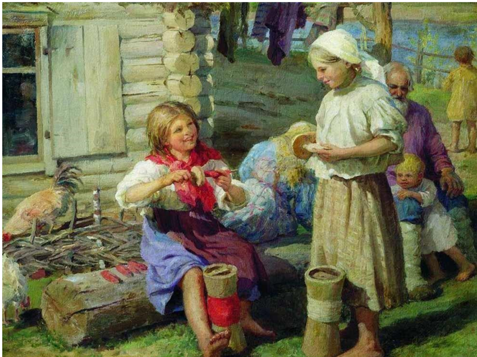
Ф. Сычков. У хаты