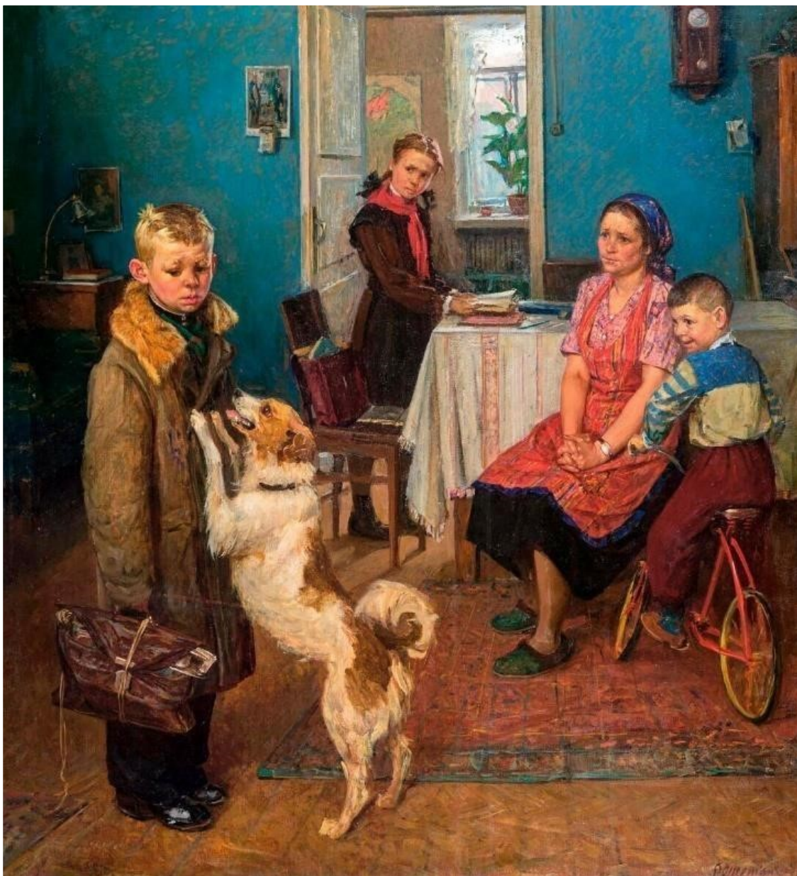
Ф. Решетников. Опять двойка