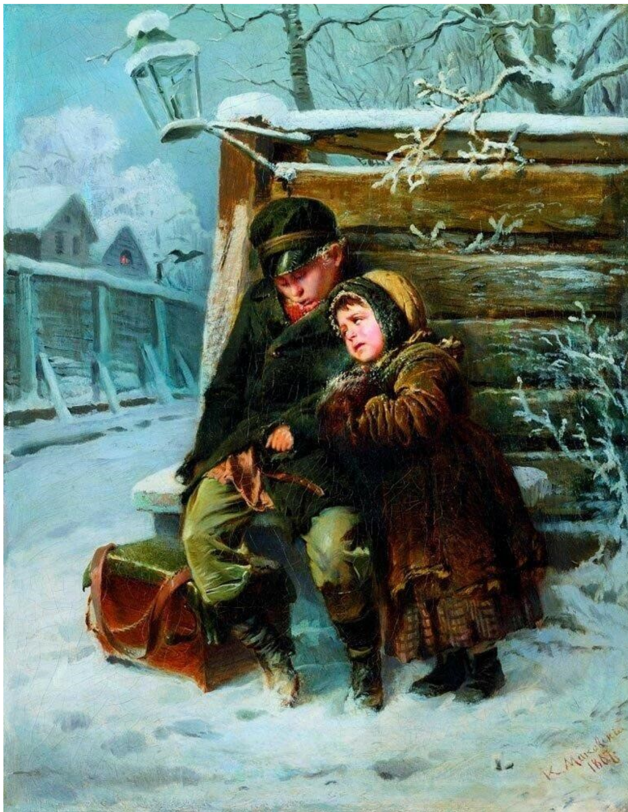
К. Маковский. Маленькие шарманщики у забора зимой