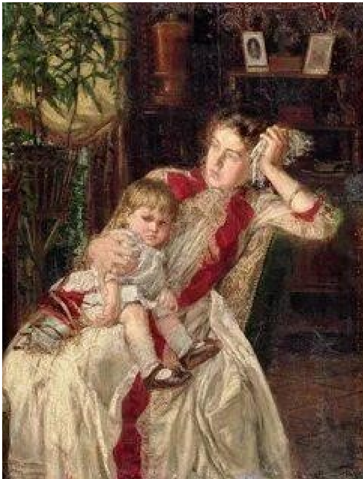
К. Савицкий. Семейная ссора