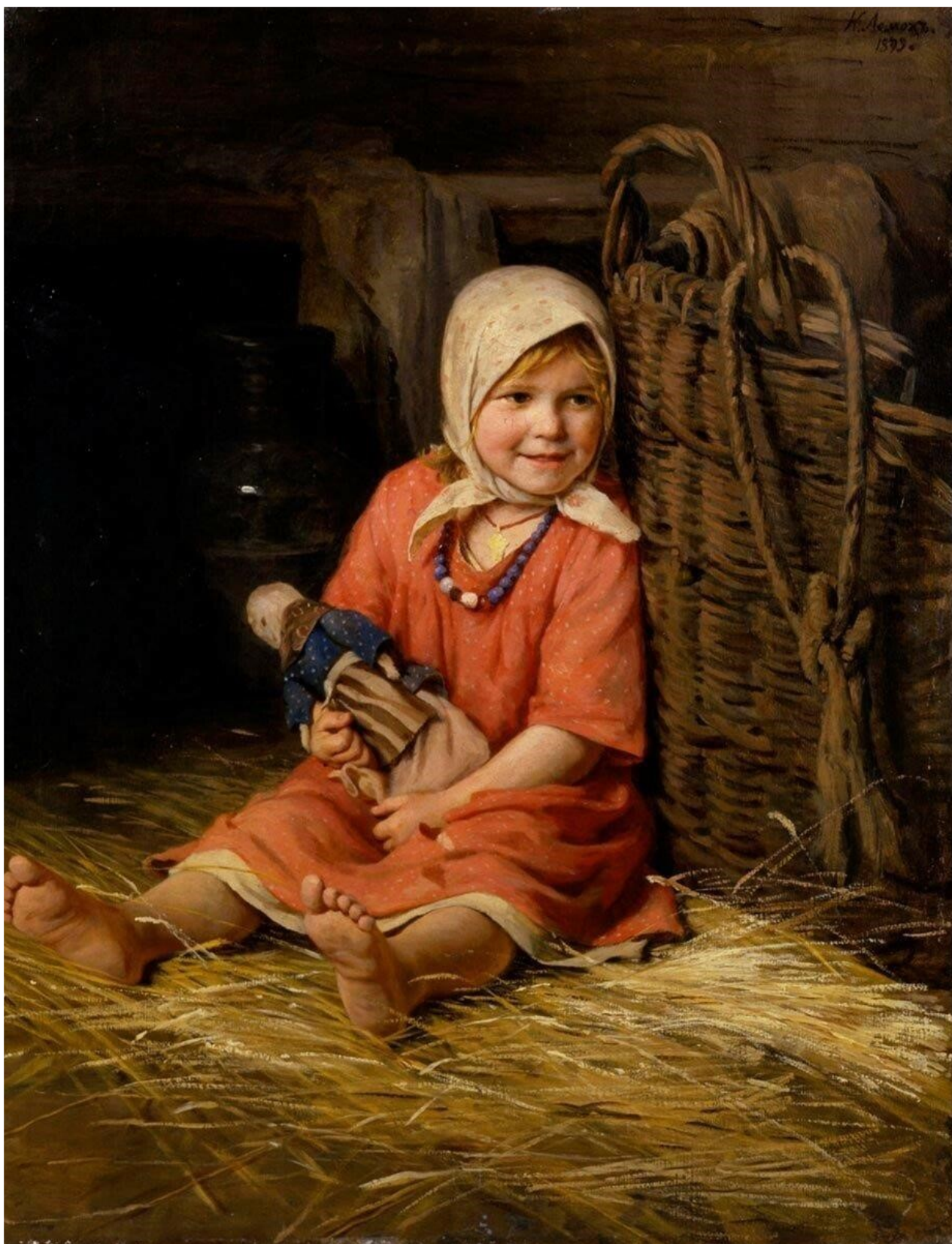
К. Лемох. Варька