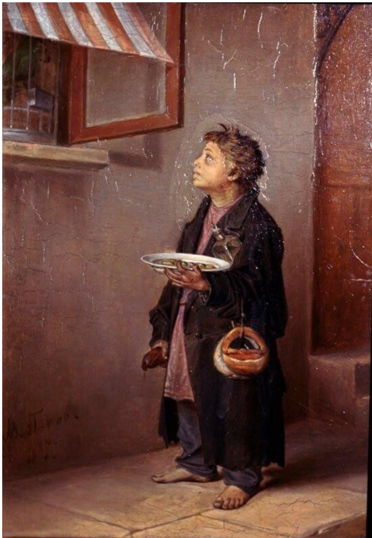
В. Перов. Мальчик-мастеровой